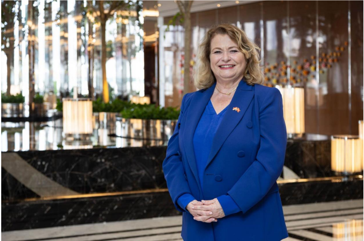
P005：摩纳哥驻华大使马思颂女士于澳门银河 莱佛士酒店留影。