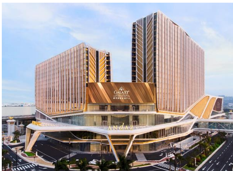
銀河國際會議中心、銀河綜藝館和安達仕酒店大樓的近照