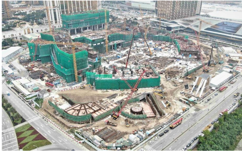
路氹第四期之近照