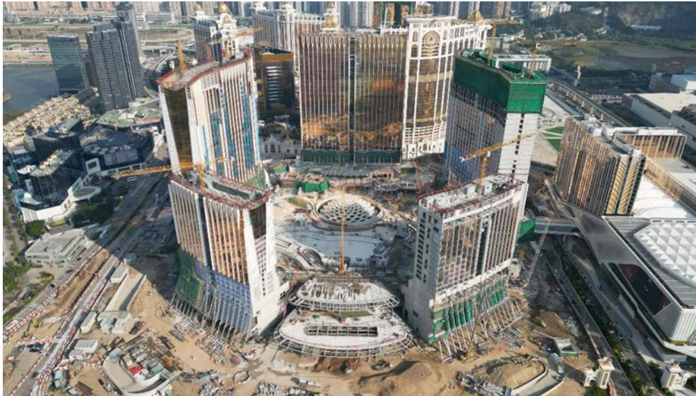
路氹第四期之最新照片 (2024 年 1 月)