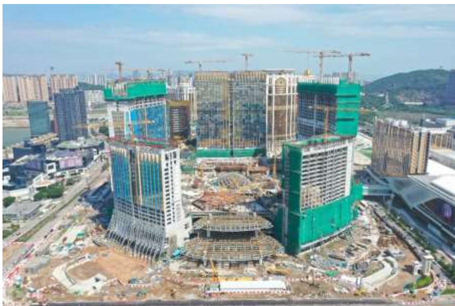
路氹第四期之最新照片 (2023 年 11 月)

銀河國際會議中心、銀河綜藝館，澳門銀河 萊佛士和澳門安達仕酒店均順利開幕。我們聚焦在已經動工的第四期項目，當中將引入多間高端並首度進駐澳門的酒店品牌，擁有 4,000 個座位的劇院、多元化的餐飲、零售、非博彩設施、園林和水上玩樂園區。第四期發展面積約 60 萬平方米，目標於 2027 年竣工但我們會繼續按市場需求情況調整發展時間表。我們透過路氹第三及四期以支持澳門成為世界旅遊休閒中心的願景，對澳門的未來充滿信心。