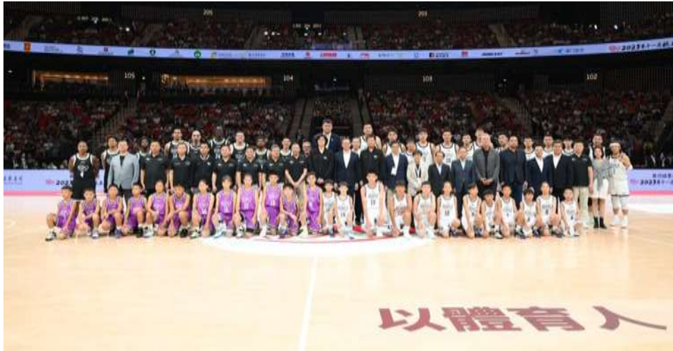
銀河國際會議中心舉辦之姚基金慈善籃球賽