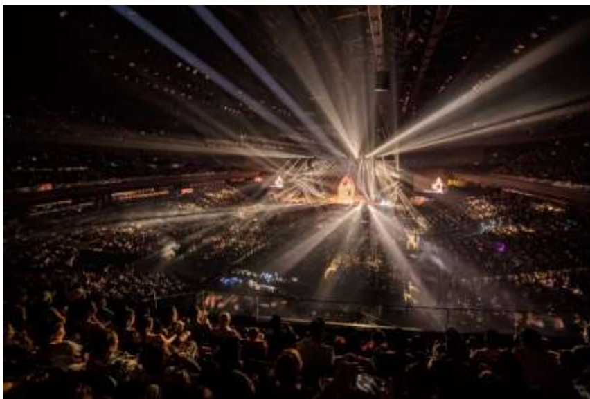
銀河綜藝館舉辦之香港歌手陳慧琳演唱會