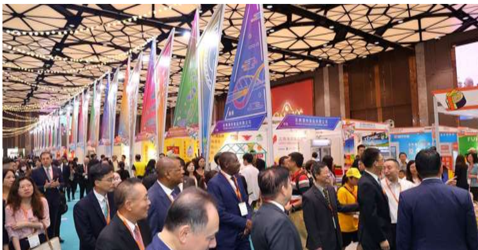
銀河國際會議中心舉辦之粵澳名優商品展