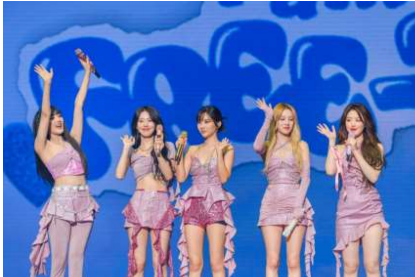
銀河綜藝館舉辦之韓國流行音樂組合(G)I-DLE 演唱會