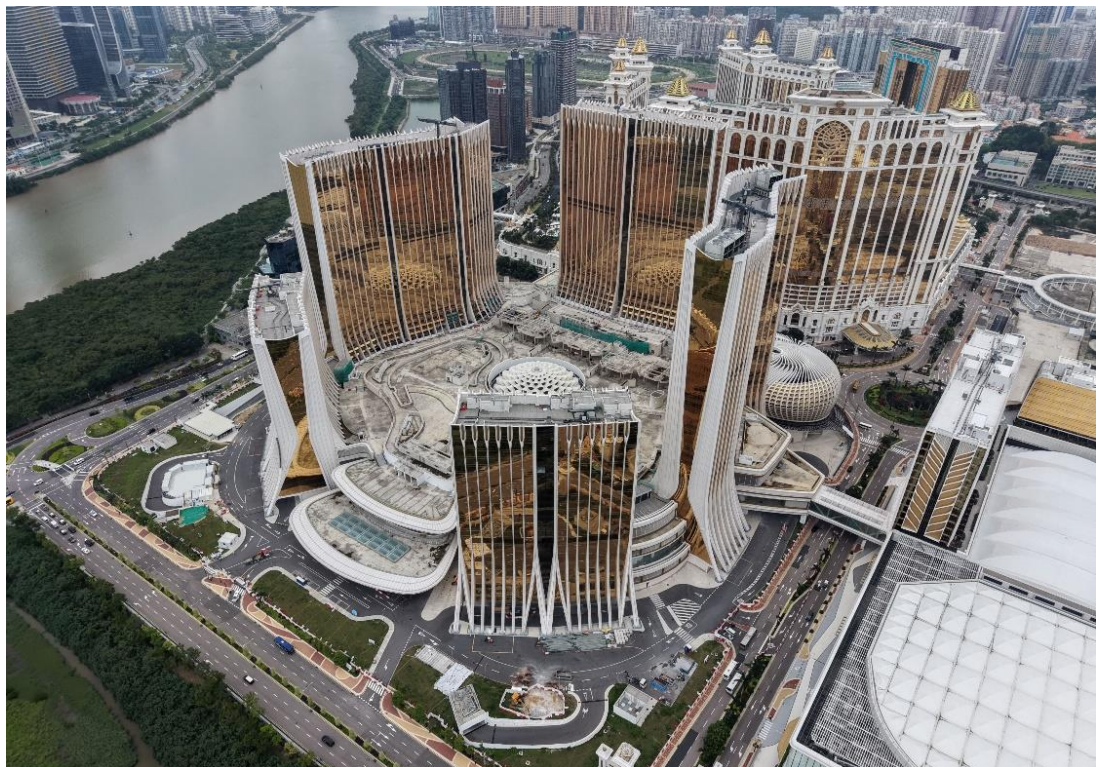
路氹第四期 (2026 年 5 月)