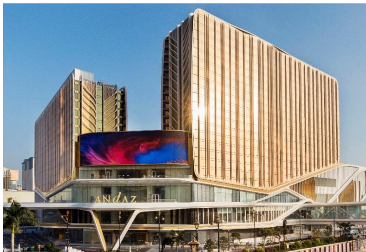
银河国际会议中心、银河综艺馆及安达仕酒店大楼之最新照片