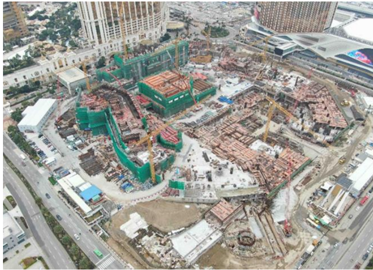
路氹第四期之最新照片