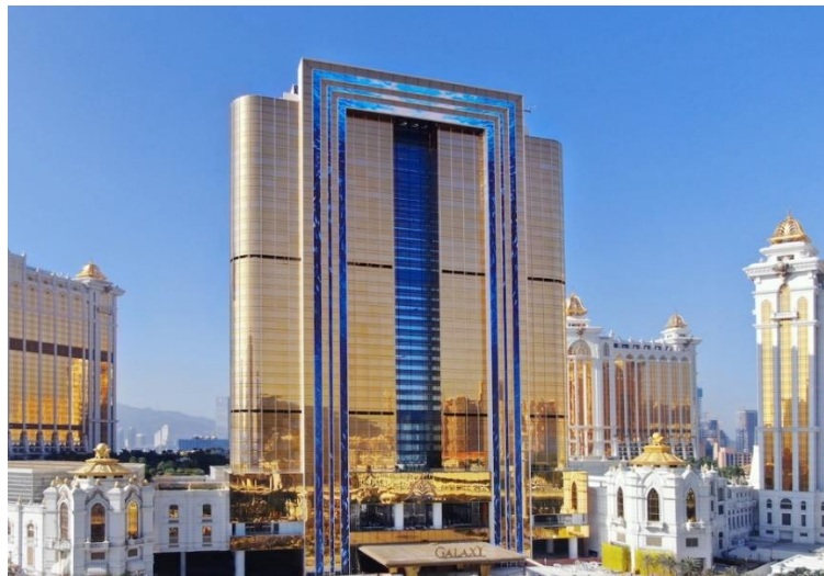
澳门银河 莱佛士之最新照片

我们预计 MICE 和娱乐市场将会复苏，因此紧随其后的是银河国际会议中心和澳门安达仕酒店的开业。我们继续推进路氹第四期的工程，此乃属于新世代综合度假城，并将令我们在路氹的发展全局得以完成。由此可见，我们透过路氹第三及四期以支持澳门成为「世界旅游休闲中心」的愿景，对澳门的未来充满信心。