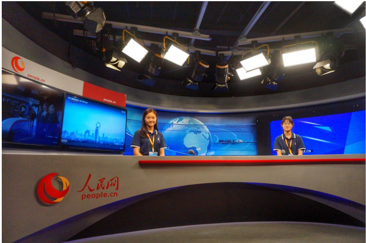
P006：每位訪京團團員均在人民日報演播室體驗難忘的的節目錄製。