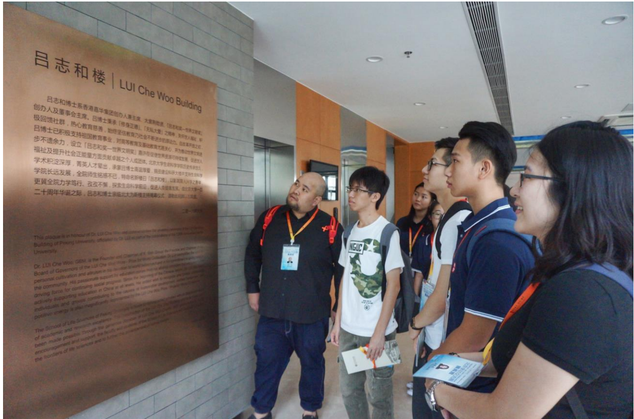
P005：部分訪京團團員細心閱讀「呂志和樓」的歷史，了解到呂志和博士對國家教育事業的多方貢獻。