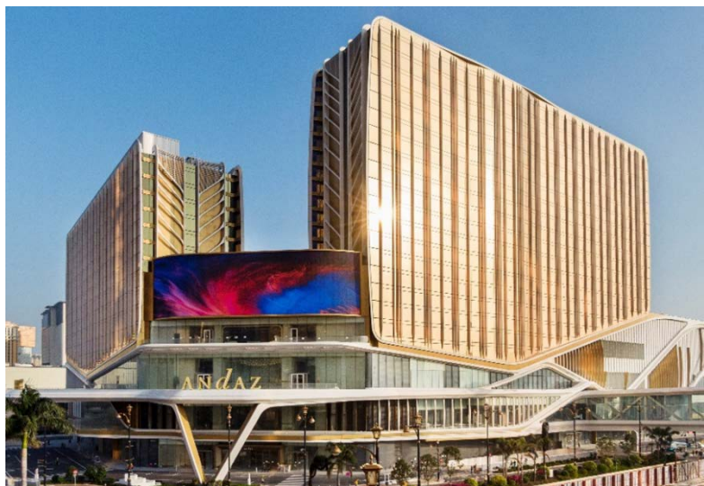
銀河國際會議中心、銀河綜藝館及安達仕酒店大樓之最新照片