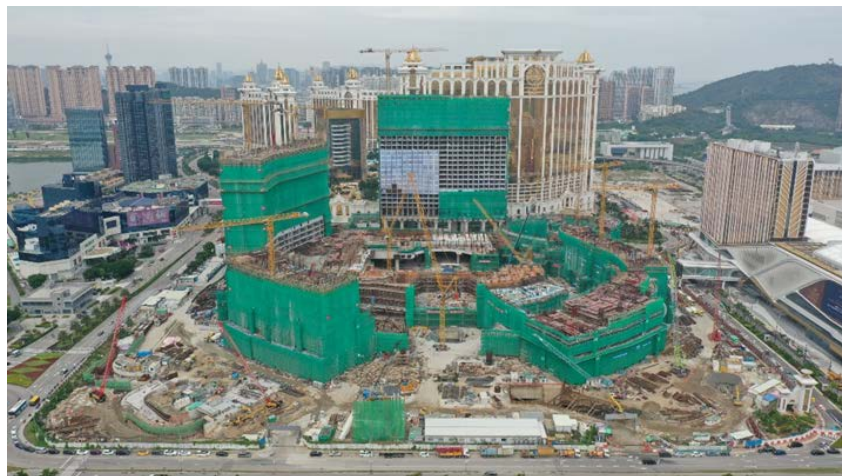
路氹第四期之最新照片