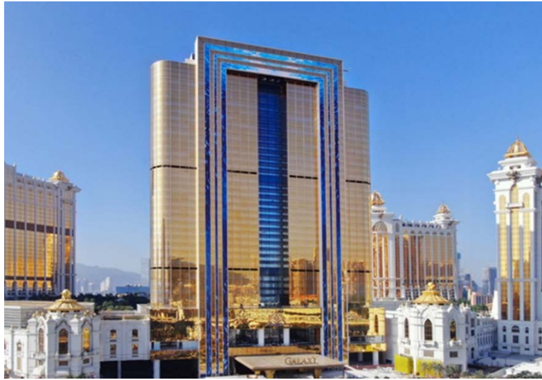
澳門銀河 萊佛士之最新照片