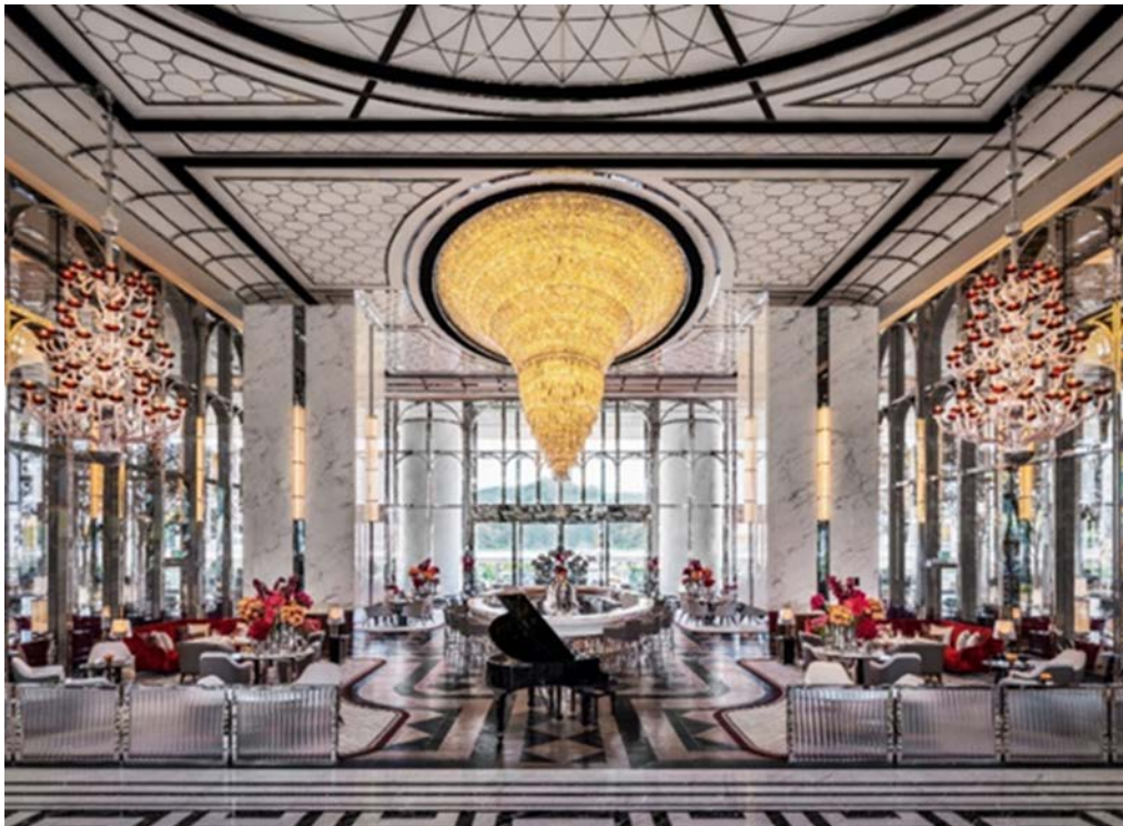
澳门银河 莱佛士大堂

(2023 年 8 月 17 日 – 香港) 银河娱乐集团(「银娱」、「公司」或「集团」)(香港联合交易所股份代号: 27) 今天公布截至 2023 年 6 月 30 日止三个月及六个月期间之业绩。(除另有注明, 所有金额均以港元列示)