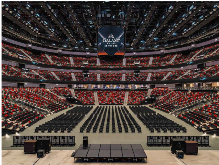
拥有 16,000 个座位的银河综艺馆