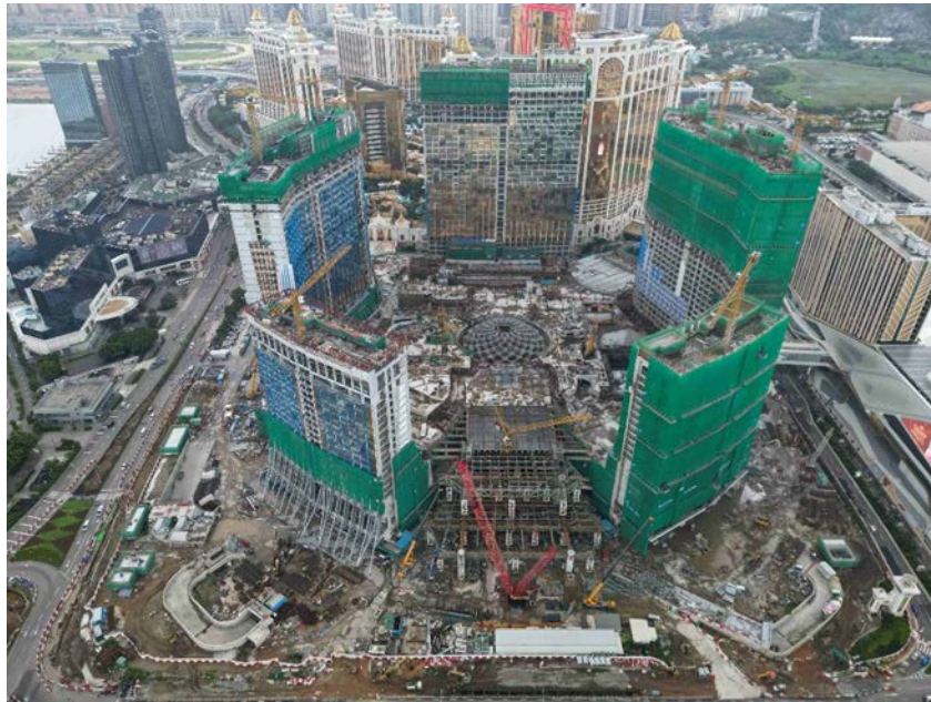
路氹第四期的最新照片 (2023 年 8 月)