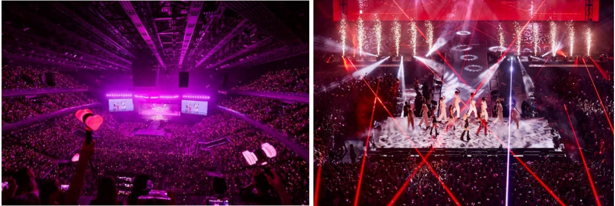
韩国流行组合 BLACKPINK 于 2023 年 5 月在银河综艺馆之世界巡回演唱会