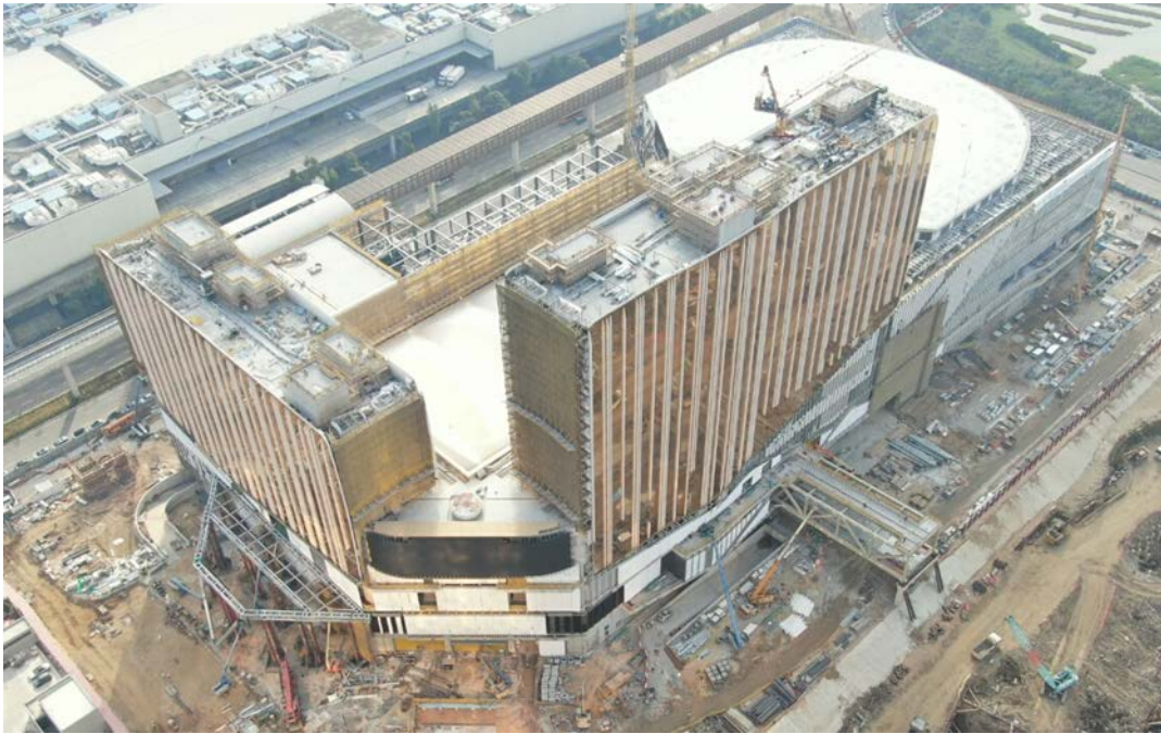
銀河國際會展中心、銀河綜藝館和安達仕酒店大樓