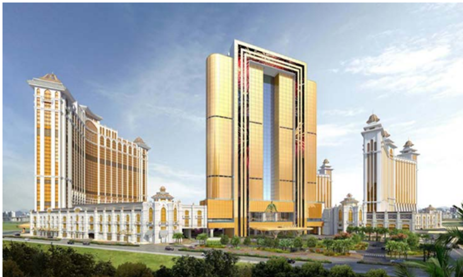
「澳門銀河™」新大樓的外觀概念圖

銀娛已為長遠的發展建立獨特定位。我們繼續推進第三及四期工程，並檢視及提升計劃以達至發展成世界級的最優質項目。我們認為高端市場正在不斷發展，這階層較喜歡高質素及寬敞的客房。第三及四期將合共提供約3,000間適合高端和家庭旅客的客房及別墅、400,000 平方呎的會議展覽空間、500,000 平方呎設有 16,000 個座位的多用途場館、餐飲、零售以及娛樂場等。我們會盡力維持發展目標，但由於受到新冠肺炎疫情波及，發展時間表有可能會受阻。目前，我們難以量化疫情的影響但會盡力維持我們的時間表。