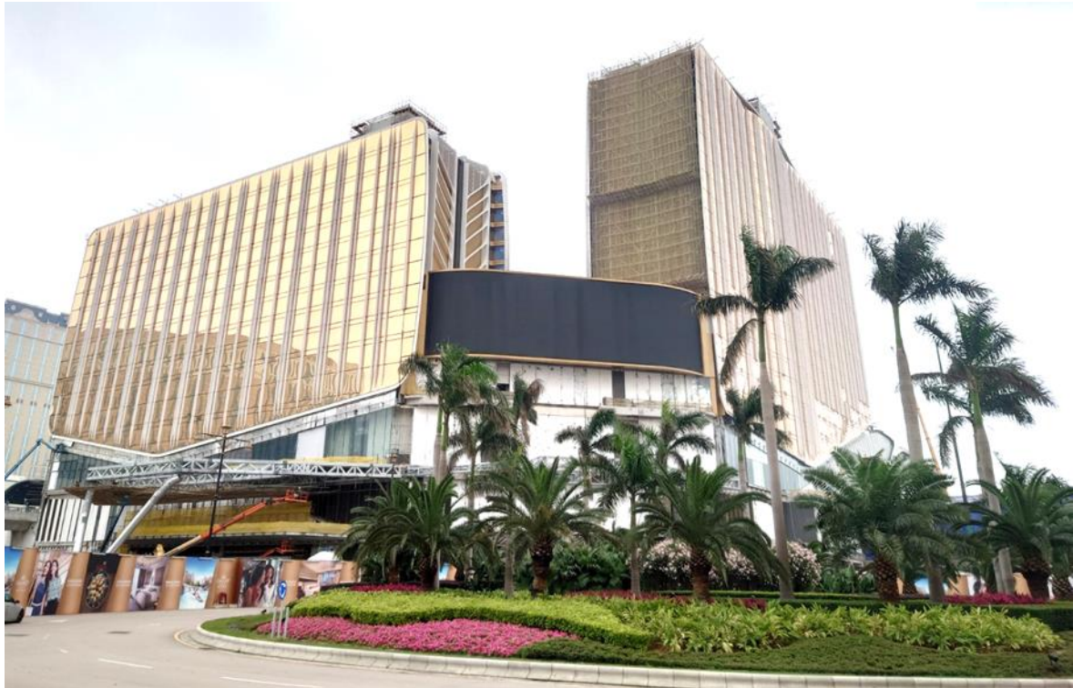
银河国际会议中心、银河综艺馆和安达仕酒店大楼