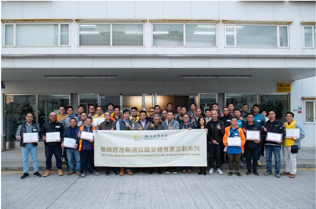
P001：銀娛項目發展部舉辦「2020 年度安全獎勵計劃」頒獎活動。