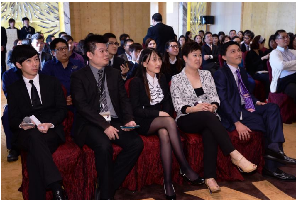
P004：银娱将透过与生产力中心紧密合作，继续为员工提供广泛的学习机会，以提升他们的竞争力。