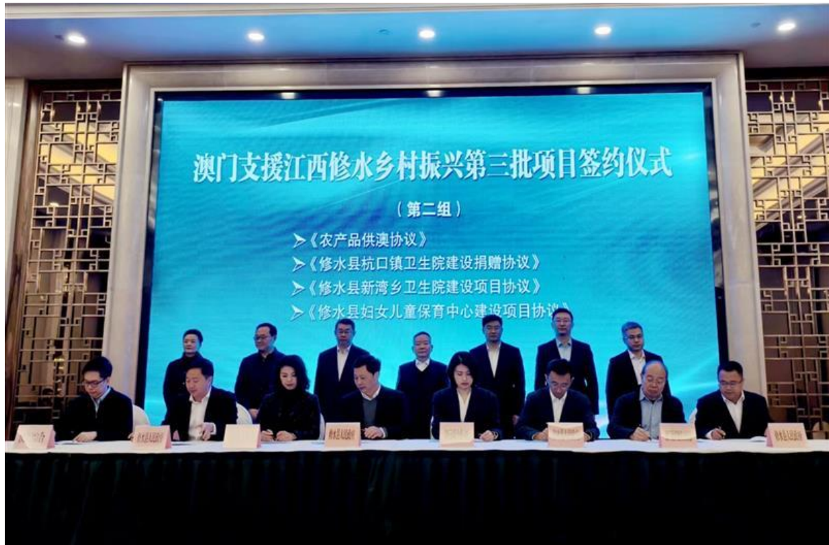
P002：銀娛代表在一眾嘉賓的見證下，與江西省修水縣人民政府代表簽署《修水縣婦女兒童保育中心建設項目協議》。