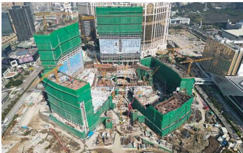
路氹第四期之最新照片 (2023 年 2 月)