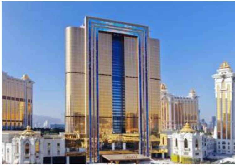
澳門銀河 萊佛士之最新照片 (2023 年 2 月)