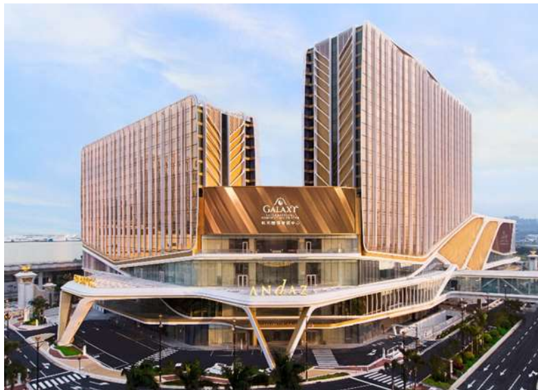
銀河國際會議中心、銀河綜藝館及澳門安達仕酒店大樓之最新照片 (2023 年 2 月)