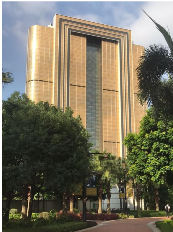
澳門銀河 萊佛士之最新照片

我們預計 MICE 和娛樂市場將會復蘇，因此緊隨其後的是銀河國際會議中心和澳門安達仕酒店的開業。此外，我們繼續推進路氹第四期的工程，此乃屬於新世代的綜合度假城，並將令我們在路氹的發展全局得以完成。由此可見，我們透過路氹第三及四期以支持澳門成為「世界旅遊休閒中心」的願景，對澳門的未來充滿信心。