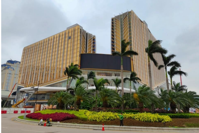
银河国际会议中心、银河综艺馆及安达仕酒店大楼之最新照片