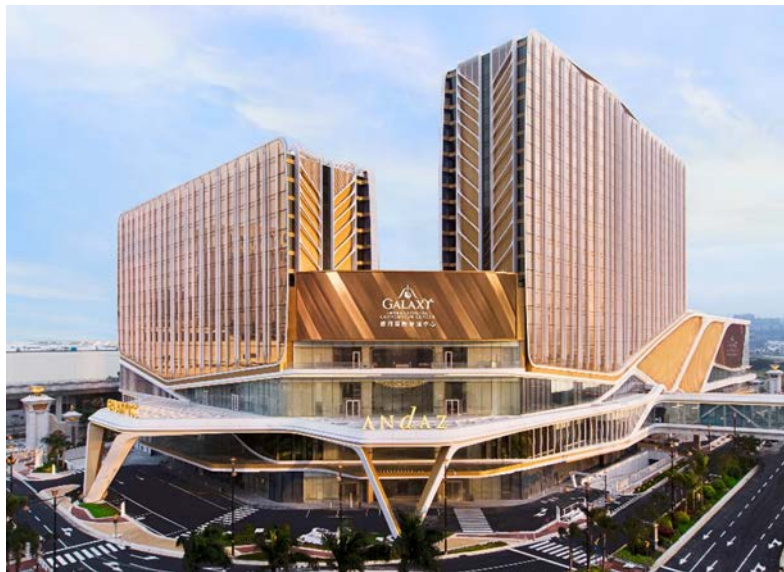
银河国际会议中心、银河综艺馆和安达仕酒店大楼之最新的近照(2023年4月)