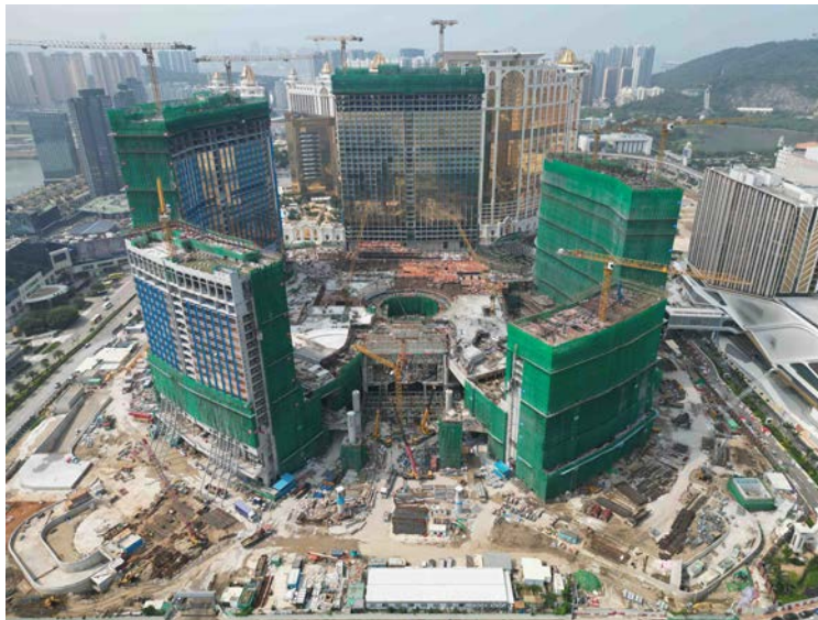
路氹第四期之最新近照(2023年4月)