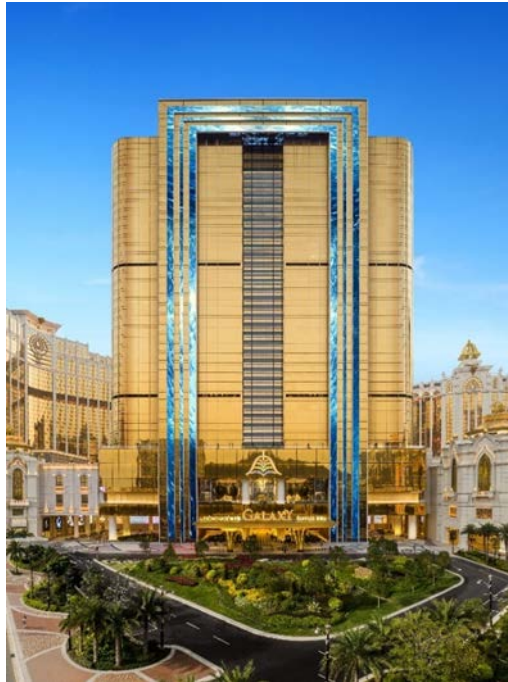
澳门银河 莱佛士之最新的近照(2023年4月)