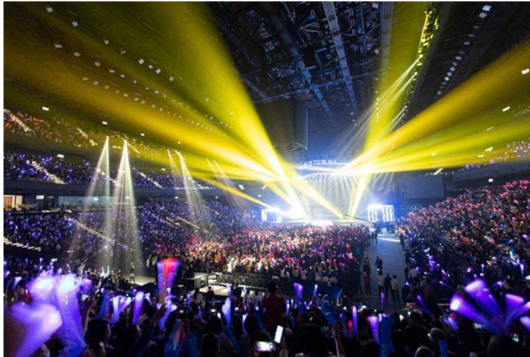
银河综艺馆最新之活动照片(2023年4月)